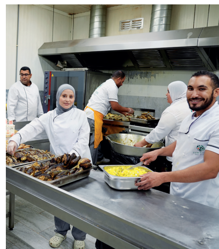
cantine de Desert Joy

Un autre aspect clé du modèle Fairtrade chez Desert Joy est l'attention portée à la liberté d'expression des travailleurs. Grâce à des structures telles que le comité des travailleurs et le comité de la prime, des réunions régulières sont organisées entre les représentants des travailleurs et le CEO. Ces échanges favorisent une communication transparente, permettant de faire remonter les préoccupations et propositions des employés, tout en créant un climat de travail positif et participatif.